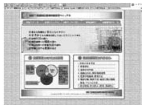
図2 電子化マニュアルの表紙画面

(4) 最終的に委員会事務局である保健所がhtmlによる電子マニュアル(図2,3)および紙マニュアルを作成した。