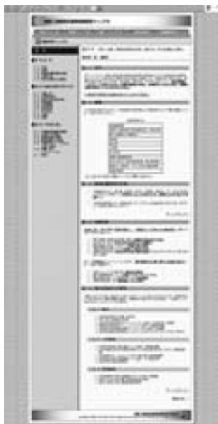
図3 電子マニュアルの目次 htmlで書いたマニュアル。クリックすることで必要な事項にジャンプする。

電子マニュアルはCD化して関係機関に配布した。紙マニュアルはPDF化して電子マニュアルからプリントアウトできるようにした。