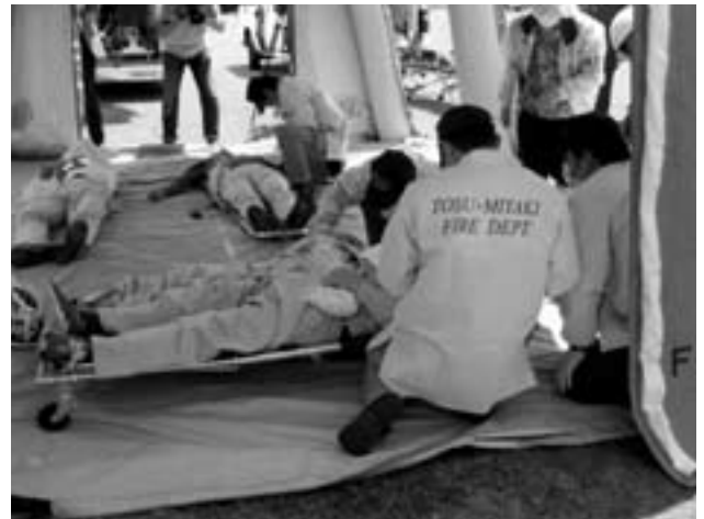
図1 実地訓練の一場面

(3) マニュアルの検証のために合同実地訓練(図1)や図上訓練を行った。さらに実際の自然災害等の際に検討結果に基づいた対応を行った。