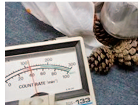
※1: 計測器はGM計数管式で、1分間当たりの放射線の数を調べます。

放射線量計測器で計測したところ1分間に120カウント※ 1 でした。マツカサにはまだ比較的高い濃度の放射性セシウムが含まれていることがあります。しかし、濃度が高くて、触れる量が少なければ線量は小さいです。