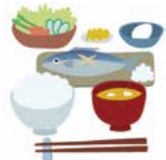
食べ物から 約1.0ミリシーベルト