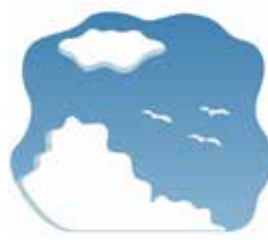
空気から 約0.5ミリシーベルト