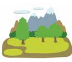
地面から 約0.3ミリシーベルト