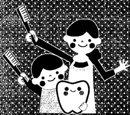
幼児や小・中・高校生の 歯みがき指導、歯科健康教育