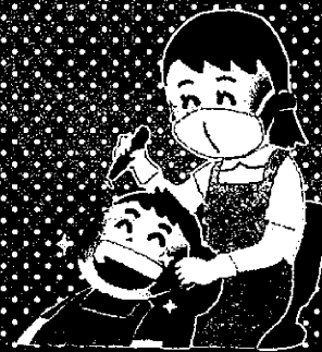
歯科診療所での 歯科衛生士業務