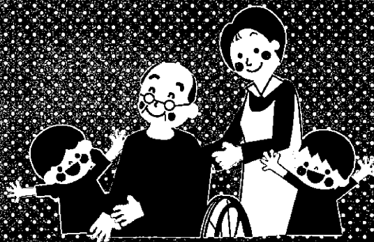
在宅・施設における 高齢者、障がい者への口腔ケア