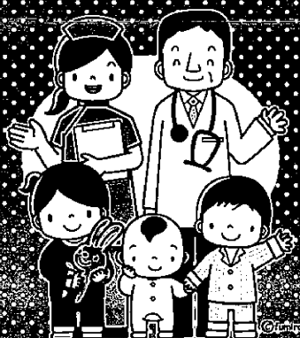
病院での口腔衛生管理