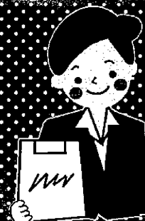
企業における歯科検診補助 及び、歯科保健指導