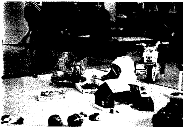
図2 集団指導後の自由遊びの様子

Teeny Angel (小さな天使) が大きな親のハートに包まれているデザイン