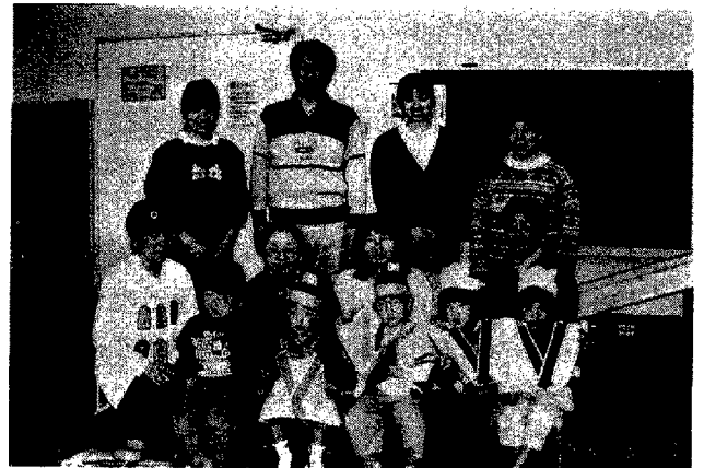
図3 雛祭りの時の集合写真

たについて親に判定してもらった。Wilcoxon 順位検定の結果、15の行動項目全てについて、EI群は対照群より上位にあり、特に項目1の行動面で動きが減ったとか、落ち着きがでたといったことで、項目8の生活のリズムが良くなった、項目9のことばの発達に関して対照群に比べ10%の有意水準で有意に親は子供の行動に満足していた(表7)。また親の心理状態の変化を中心とした庄司 13) の検討ではEI群と対照群を比較すると、からだについての心配は1年後には54.2%から34.4%に、精神的な面でも36.7%から18.2%に低下し、日常の行動面では心配があるが29.2%から45.5%に上昇していた。この結果はEIにより知能や言語の遅れといった深刻な問題についての心配が減少し、現実的な養育上の問