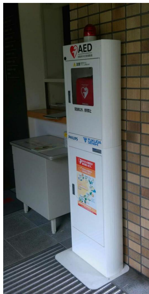
別館棟 入口 エレベーター横