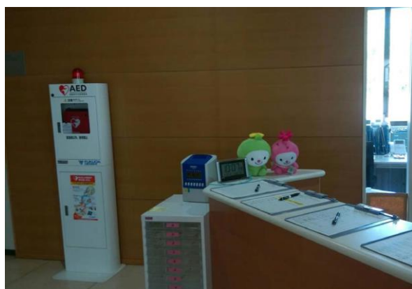
本館棟1階 正面玄関 受付横