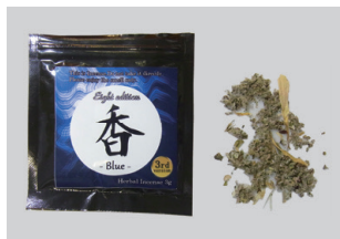
危険ドラッグ（ハーブ系）

規制が強化され販売ルートも限定的になりましたが、覚醒剤や大麻に似た成分が含まれていることもある大変危険な薬物です。