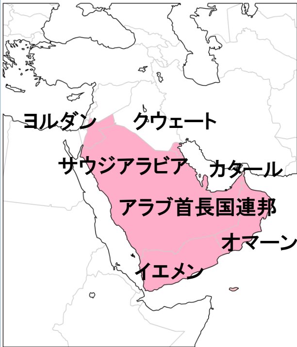
Confirmed global cases of MERS-CoV Reported to WHO as of 25 Aug 2017 (n=2067)