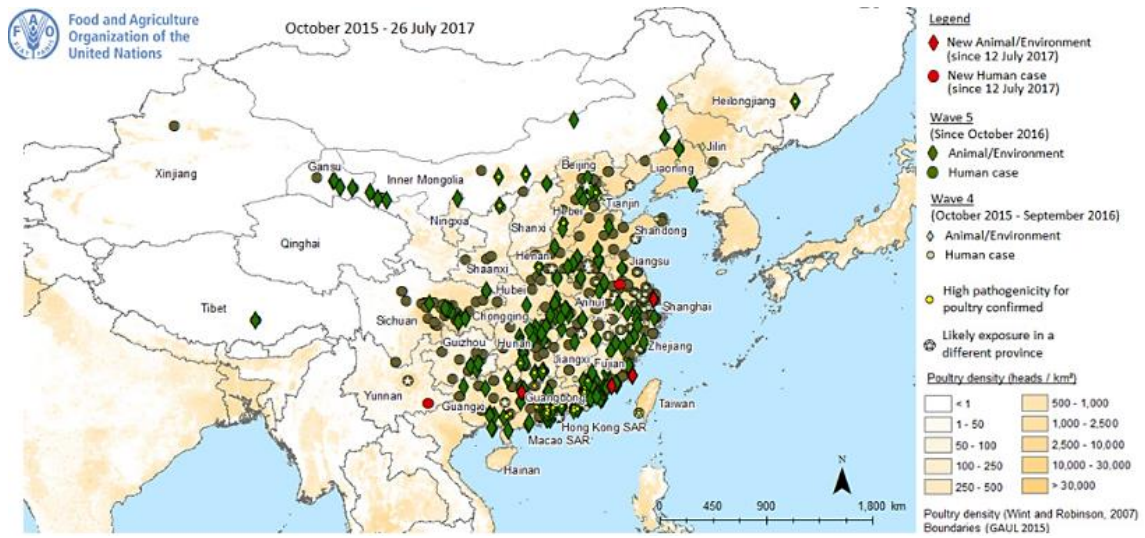
図3. 中国本土の鳥インフルエンザ A (H7N9) ヒト患者とトリ・環境中の陽性例の報告地域 2015年10月～2017年7月26日 (文献21から引用)