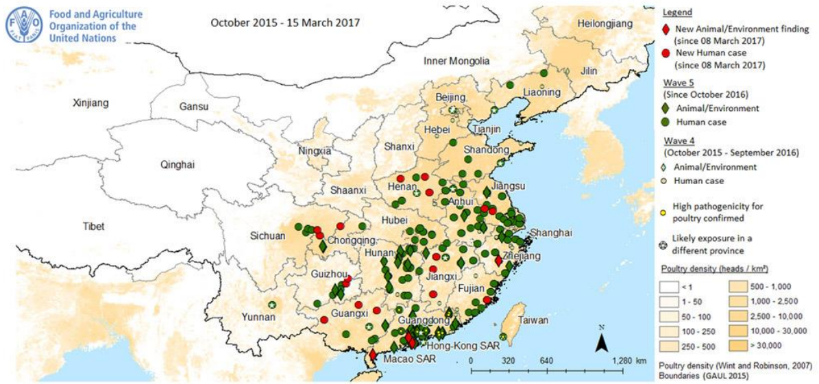
図3. 中国本土の鳥インフルエンザ A (H7N9) ヒト症例とトリ・環境中の陽性例の報告地域 2015年10月～2017年3月15日 (文献14から引用)