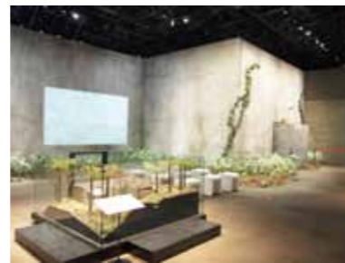
縮尺1/20の模型(手前)と実寸大で部分再現された重監房

また、ガイダンス映像や証言ビデオなどの映像が見られるほか、歴史パネルや実物資料を展示したコーナーなどがあります。