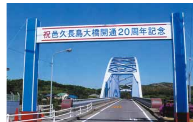
人間回復の橋と呼ばれる邑久長島大橋

長島と対岸の虫明を結ぶ邑久長島大橋は、1988年(昭和63年)に開通しました。隔離する必要のない証、人間回復の証として架橋され、現在は民間バスも乗り入れ、入所者も自由に島外に出かけられるようになっています。