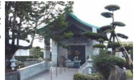
星塚敬愛園の納骨堂

高齢や後遺症、周囲の偏見などを乗り越えて、療養所を退所して社会復帰した人もいますが、その数は決して多いとはいえません。療養所に入所したときに、家族に迷惑が及ぶことを心配して本名や戸籍を捨てた人もいたため、現在も故郷に帰ることなく、肉親との再会が果たせない人もいます。療養所で亡くなった人の遺骨の多くが実家のお墓に入れず、各療養所内の納骨堂に納められています。