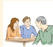
※本名ではない名前

私は12歳で発病し、故郷の愛知県から父親に連れられて療養所に入りました。すぐに本名を俗名*に変えることを勧められました。私の実家は真っ白になるまで消毒され、村八分のように引越せざるをえなかったと後で聞きました。いずれ日本に「ハンセン病の元患者」はいなくなります。しかし、偏見と差別が残るまま、我々の人権が侵されたままでは見過ごせない。そういう思いから、私たちが置かれた境遇を若い人たちに話す機会を大事にしています。つらい病気を体験する人はどの時代にもいます。でも、国の政策や法律によって悲惨な思いをするのは、私たちを最後にしてほしいのです。