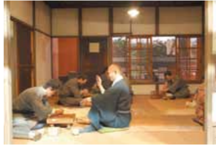
昔の療養所の暮らしが再現されています

全国のハンセン病療養所や国内外の関係機関から収集した資料が数多く展示されています。ハンセン病に関する約30,000冊の図書を収蔵した図書閲覧室もあります。