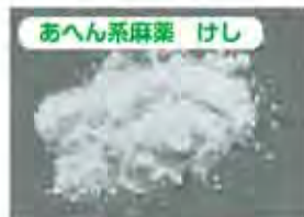
あへん系麻薬 けし