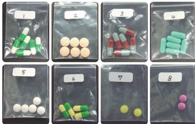
健康被害をもたらした「ホスピタルダイエット」製品

「ホスピタルダイエット」と称する製品を、インターネットを通じてタイから個人輸入し、服用した20歳代女性が排尿困難、意識もうろう、手足の震えなどの症状で入院した。服用していた製品(8種類のカプセル及び錠剤)からは医薬品成分が検出された。この他、「ヤンヒーホスピタルダイエット」「MDクリニックダイエット」などと呼ばれる製品については、死亡(疑い)事例を含む健康被害が複数報告されており、医薬品成分の検出が確認されています。