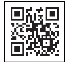
新冠疫苗接種 導航網二維碼