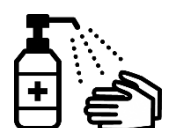
用手指專用消毒酒精 進行消毒

關於新冠疫苗的有效性與安全性等詳細資訊，請瀏覽厚生 勞動省網站的「關於新冠疫苗」頁面。