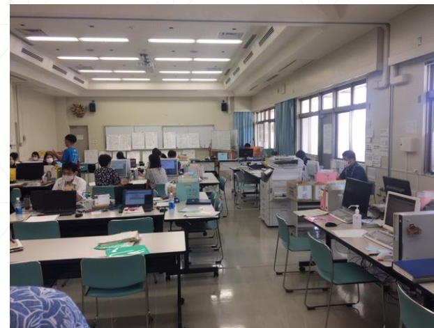
県と保健所でのWeb会議・操作説明