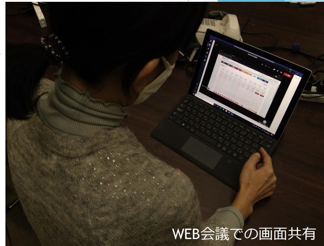
WEB会議での画面共有