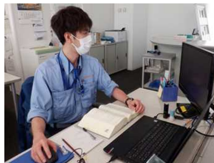
コンピュータシステムによる届出審査

令和3年度の輸入届出は、件数で2,455,182件、重量で約3,163万トンであった。輸入届出のうち、204,240件に対して検査を実施し、このうち809件（延べ857件）に法違反が確認され、積み戻しや廃棄等の措置を講じた。これは届出件数の0.03%に相当する（ 表1 ）。