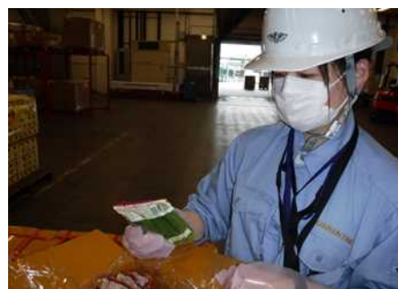
保税倉庫での検体採取

令和3年度は49,493件（計画件数延べ99,995件に対し101,365件（実施率：約101%））を実施し、このうち157件（延べ157件）に法違反が確認され（ 表2 ）、回収、廃棄等の措置を講じた。