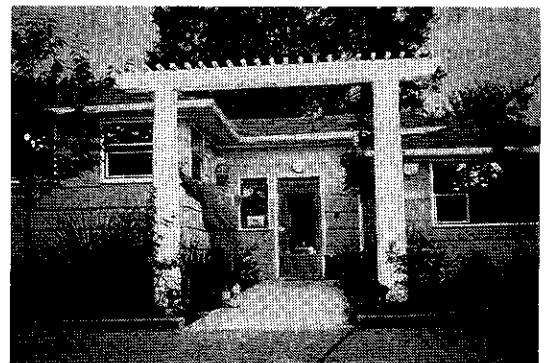
エイズ末期患者の共同住宅 “Rosehedge”

この目まぐるしい 1 週間の後、HIV 専門外来の Madison Clinic に通うことになった。ダウンタウンの