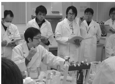
図1(a) デモンストレーションの様子