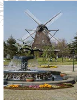
アンデルセン公園