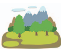
地面から 約0.3ミリシーベルト