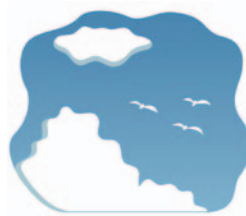
空気から 約0.5ミリシーベルト