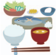
食べ物から 約1.0ミリシーベルト