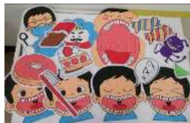
保育園・幼稚園等で使用している媒体

歯やお口の健康についてわかりやすく伝えるために、それぞれの事業や対象に合わせて、資料や媒体を作成して話をしています。どんな話を聞きたいのか、どのように媒体を活用すると伝わりやすいか、日々研究しています。