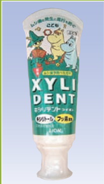
キシリデント 子ども (ライオン)