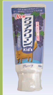
NEW クリアクリーン (花王)