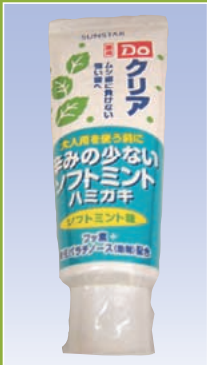
Doクリア 子どもハミガキ ソフトミント味 (サンスター)