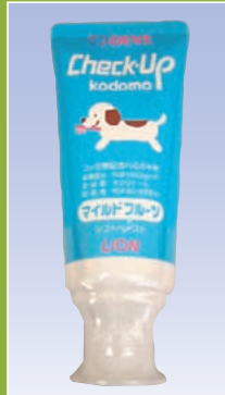
Check-Up kodomo (ライオン)