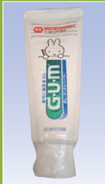
家庭の歯医者さん ガム・デンタルペースト (サンスター)