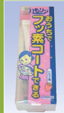
ハモリン おうちで フッ素コートできる (丹平製薬)