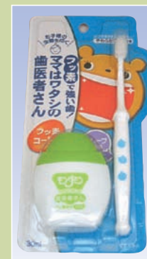
ママはワタシの 歯医者さん (アース製薬)