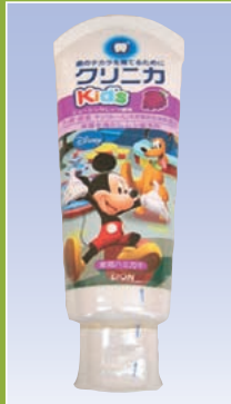
クリニカKid's (ライオン)