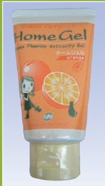
ホームジェル (オーラルケア)