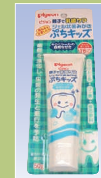
ジェル状はみがき ぶちキッズ (ピジョン)