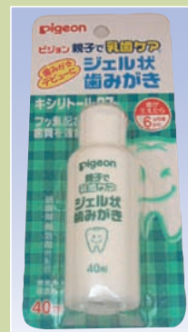
ジェル状はみがき (ピジョン)