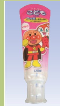
子どもハミガキ (ライオン)