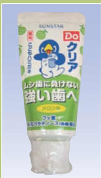
Doクリア 子どもハミガキ イチゴ味/メロン味 (サンスター)