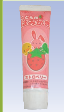
子ども用はみがき (GC)