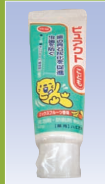
子どもハミガキ ピュアクト (日本生活共同組合連合会)