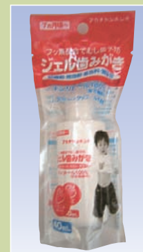
ジェルはみがき (アカチャンホンポ)